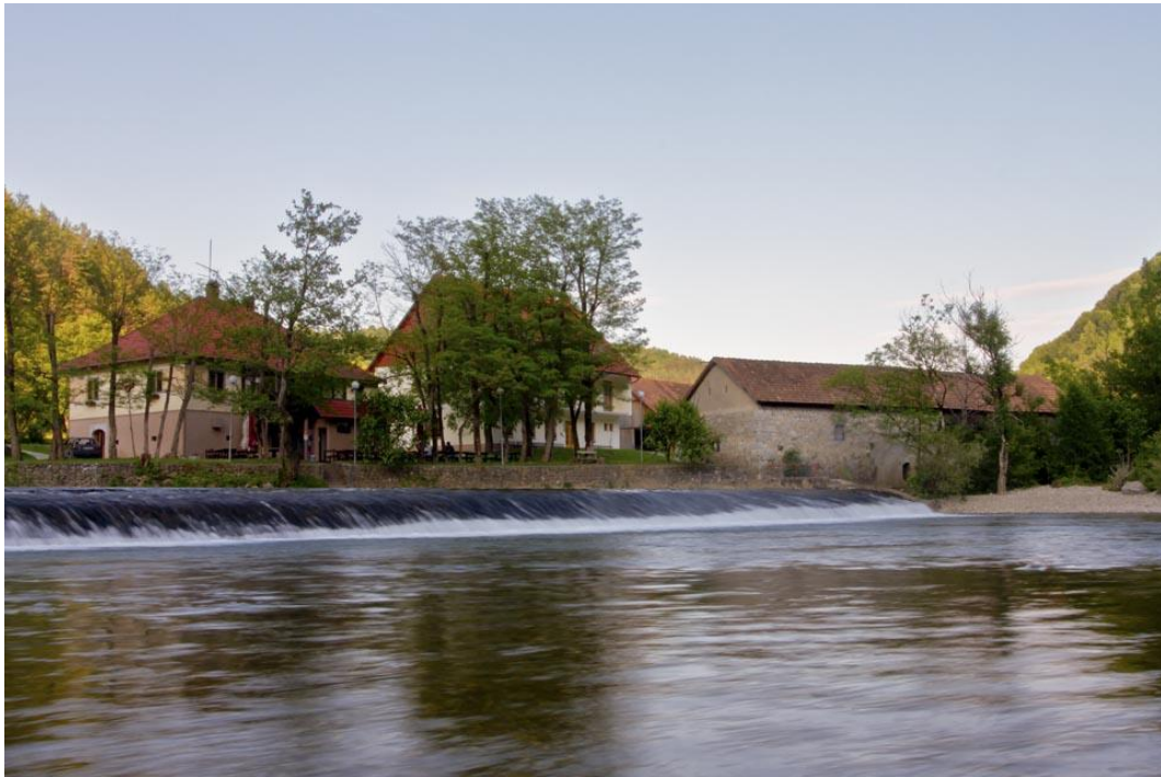
Slika 2: Pri Madroniču

V družinskem podjetju Madronič gostom poleg najboljših postrvi ponujajo tudi prenočišča v sobah ali spanje na seniku, kar je v današnjem času prava redkost. Zato smo se tudi mi odločili, da bodo udeleženci našega dogodka spali na seniku in na ta način spoznali delček iz življenja njihovih prednikov.