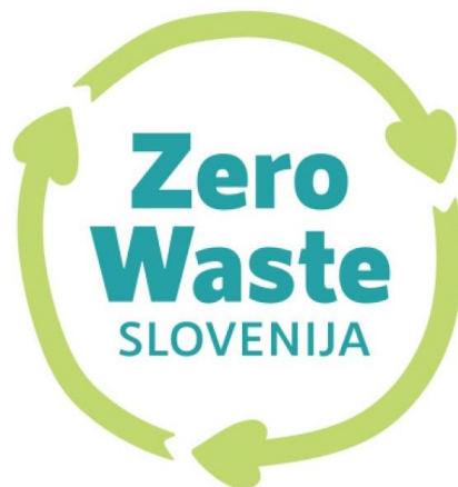
Slika 8: Logotip Zerowaste Slovenija