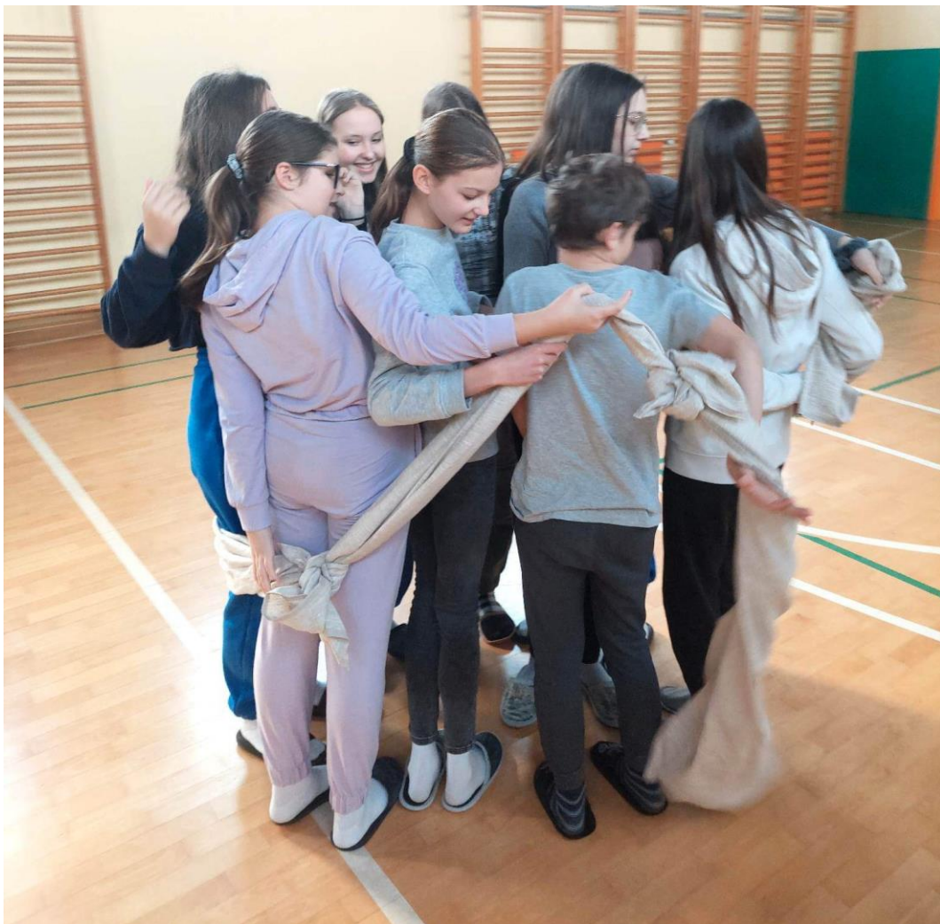
Slika 4: Zavita kača

Udeleženci brisače zvijejo in zvežejo v daljšo kačo. Nato stopijo v gručo. Eden od udeležencev prime kačo in jo močno drži. Ostali se po zunanji strani z njo ovijajo, dokler kača ni zavita. Pomembno je, da jo na začetku in na koncu drži po en učenec.