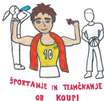
Slika 7: Logotip

Teamko je najstnik, športnik, ki živi na seniku pri Madroničevih. Neizmerno uživa v vseh športnih aktivnostih, še posebej ga navdušujejo vodne dogodivščine, rad pa se odpravi tudi peš ali s kolesom po Poljanski dolini. Zaveda se pomena zadostne športne aktivnosti, prav tako pa so mu pomembni tudi dobri medsebojni odnosi.