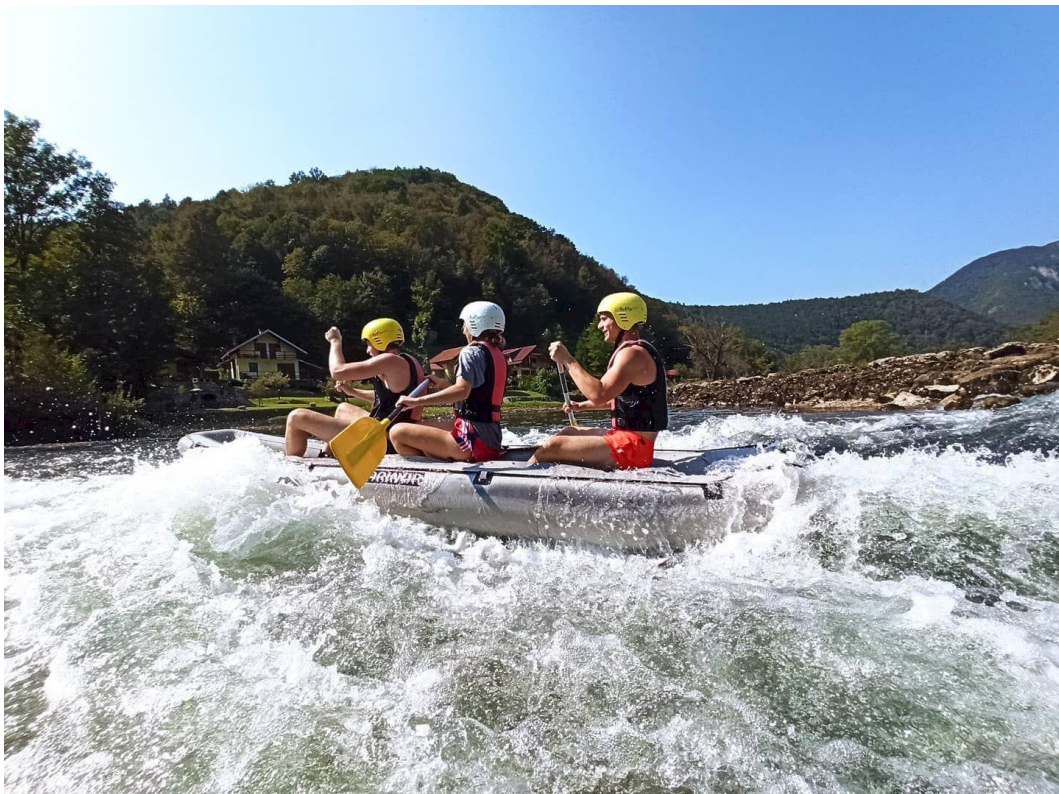
Slika 1: Rafting na Kolpi

Na dogodku se bodo obiskovalci preizkusili v športno obarvanih teambuiding igrah, s katerimi bodo udeleženci krepili medsebojne odnose, saj so vse igre zasnovane po načelu sodelovanja med udeleženci. Nismo pa pozabili tudi na to, da udeležencem omogočimo prostočasne aktivnosti, ki bodo prav tako športno obarvane. Zagotovo pa bo prava dogodivščina za vse udeležence, ko se bodo zadnji dan druženja vsi skupaj z rafti podali na pustolovščino po reki Kolpi od Dola do Radencev. Na njihovih aktivnostih jih bo ves čas spremljala naša maskota Teamko, ki bo poskrbel za dobro voljo, smeh in zabavo.