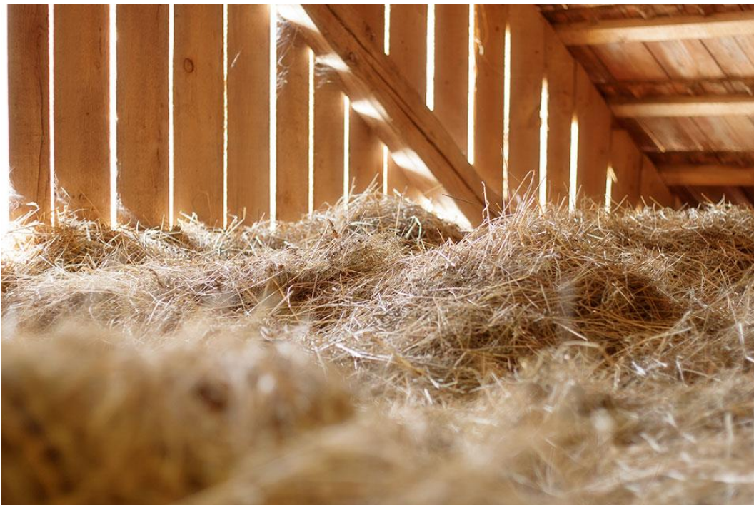
Slika 6: Spanje na seniku

Družabnemu večeru ob ognju bo sledilo spanje na seniku. To je izvrstna priložnost zanje, da v nočni tišini ob žuborenju Kolpe ter stran od sodobne tehnologije izkusijo, kako so nekoč spali naše babice in dedki.