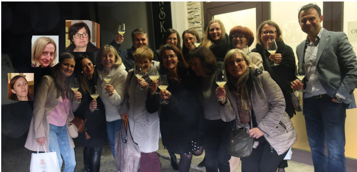
Kolektiv šole na ogledu Vinske kleti v Metliki.