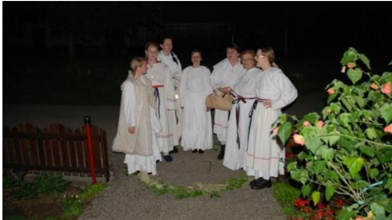
Slika 5: Ljudske pevke Kresnice

V Beli krajini, najbolj prav v Adlešičih, se je ohranila navada petja Kresnic, ljudskih pevk, ki pojejo kresne in stare ljudske pesmi ter tako ohranjajo ljudsko izročilo kraja. Druži jih veselje do petja in druženja. Naše obiskovalce bodo očarale s svojim petjem in naredile edinstven uvod v vikend vodnih doživetij ob Kolpi.