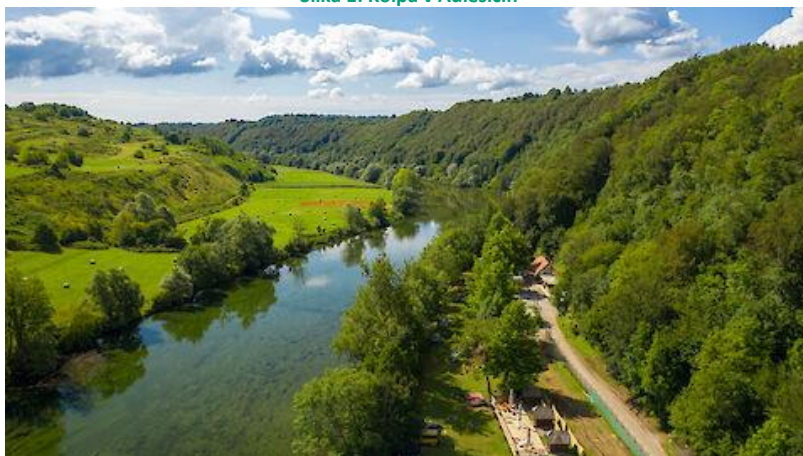
Slika 1: Kolpa v Adlešičih

Najdaljša slovenska riviera pa ni samo najpomembnejši vodni vir Bele krajine, ampak ponuja tudi idiličen prostor za številne možnosti aktivnega preživljanja prostega časa. Svoj mir lahko tukaj najdejo ribiči, kopalci, potapljači, čolnarji, pohodniki, kolesarji, ljubitelji plezanja in številni drugi, ki imajo radi neokrnjeno naravo in zdrav način življenja (Naravni Parki Slovenije, 2022).