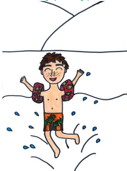
Slika 9: Logotip turističnega produkta

Vodoljub simbolizira pomen vode v človekovem življenju, obiskovalce spremlja na dogodkih v okviru našega tridnevnega programa in jih opominja na pomen pitja zadostne količine vode med telesno aktivnostjo, pa tudi o pomenu pitja vode na sploh. Zaradi teh razlogov smo mu tudi nadeli ime Vodoljub, ki pomeni nekoga, ki ima rad vodo.