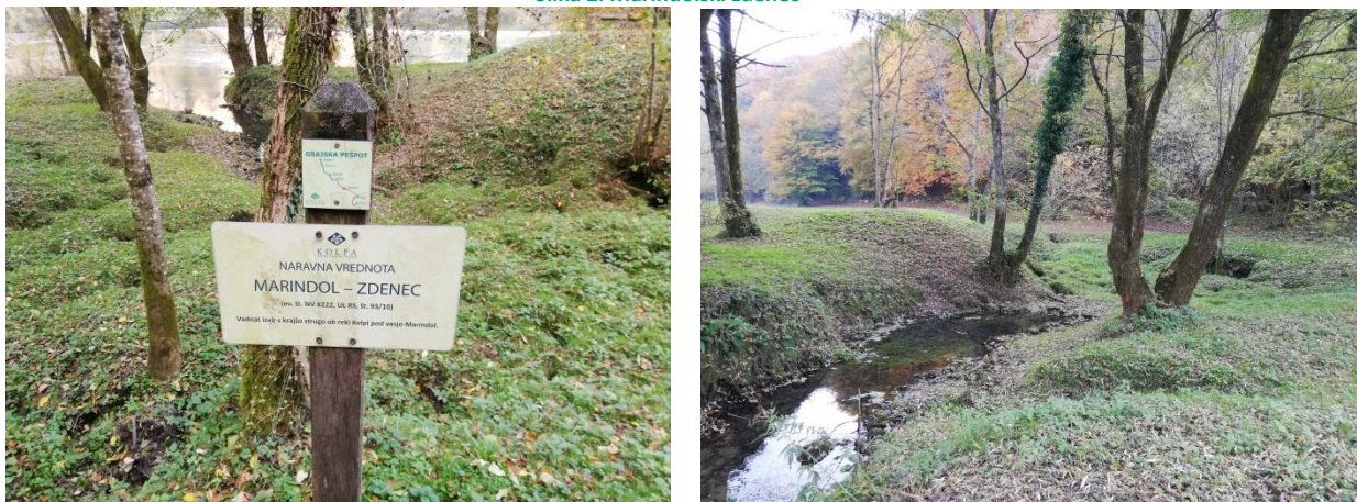
Slika 2: Marindolski zdenec

Ko se sprehajamo ob reki Kolpi, najdemo številne manjše studenčke (npr. Vušivec, Marindolski, Dolenjski in Fučkovski zdenec ...), ki so bili še nedolgo pomemben vir pitne vode lokalnim prebivalcem. Danes na žalost temu ni več tako, predstavljajo pa nam opomnik, da je vodne vire treba skrbneje varovati. Prebivalci smo tisti, ki moramo odgovorno ravnati z naravo in jo ohranjati tudi za bodoče rodove. Prav je, da svoje naravne lepote delimo tudi s turisti, a s svojimi dejanji in zgledom moramo vplivati nanje, da bodo tudi oni ravnali enako.