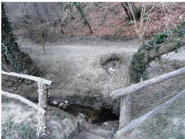
Slika 4: Zdenec Vušivec

Na cilju bo pohodnike pričakalo glasbeno presenečenje – ljudske pevke Kresnice.