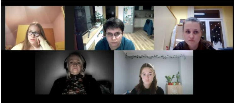
Slika 11: Intervju preko Zooma

Z lastnico kampa Stari pod smo preko aplikacije ZOOM izvedli intervju. Predstavili smo ji naš turistični produkt, ki se bo odvijal v Starem podu ob reki Kolpi v začetku meseca julija.