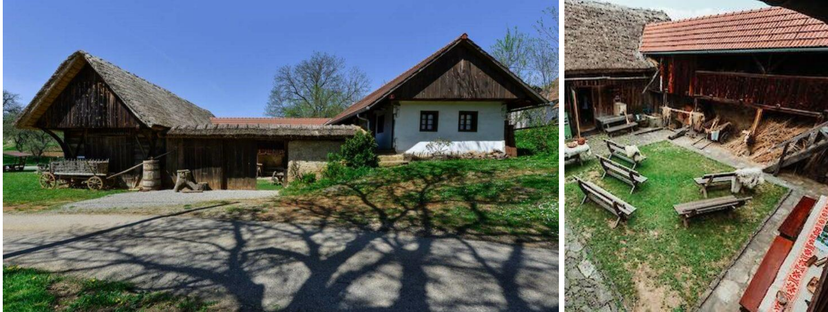
Slika 8: Šokčev dvor

iz zdencev v barilčkih (5- do 6-litrskih sodčkah), odrasli pa s svitkom na glavi v kabljenikih (kad).